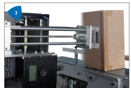
3 Veelzijdig, labels aanbrengen aan de bovenkant, onderkant of zijkant in elke rotatiehoek.